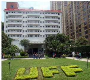
Vista da fachada com a pérgula a ser retirada Data desconhecida

Importante registrar que a revitalização do Centro de Artes UFF atendeu a essa recomendação e foi aprovada pelo Conselho Municipal de Patrimônio Cultural – CMPC em 2008.