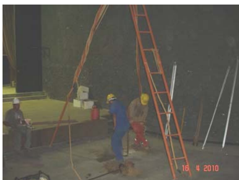
Execução da sondagem no piso do cinema

Nesse sentido, face à inexistência de registros que representassem a atual situação do prédio, foi previsto nos serviços contratados em 2009 a averiguação das estruturas existentes – lajes, pilares e vigas, bem como de alvenaria, instalações e demais elementos construtivos para fins de desenvolvimento do projeto executivo. Também foi necessária a realização de sondagens para definir o tipo de fundação que seria projetada para a área do cinema e da varanda.