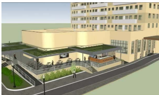
Perspectiva do Projeto Revitalização Centro de Artes UFF

Importante registrar que a revitalização do Centro de Artes UFF atendeu a essa recomendação e foi aprovada pelo Conselho Municipal de Patrimônio Cultural – CMPC em 2008.