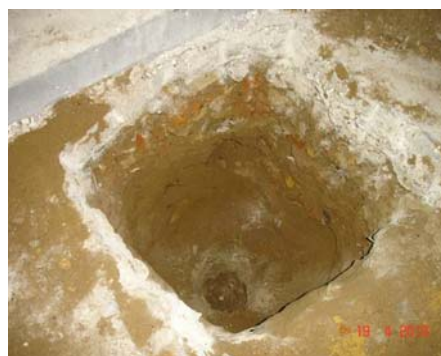
Prospecções da laje do piso do cinema

Em se tratando de projeto de reforma de parte do prédio datada do início do século passado, e devido às prospecções e aprofundamentos do diagnóstico de suporte ao desenvolvimento dos projetos executivos, algumas soluções propostas inicialmente necessitaram de reavaliações.